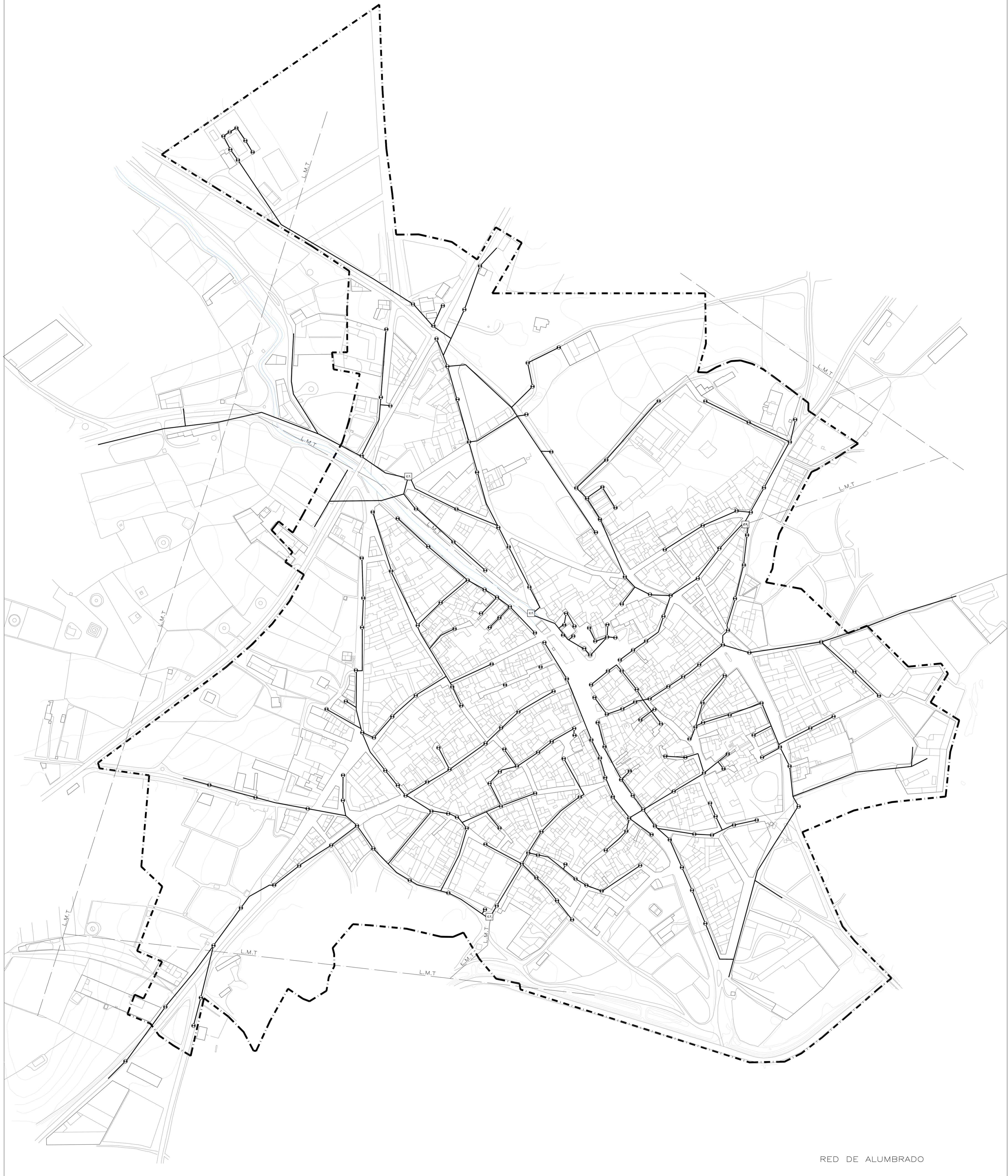
RED DE ALUMBRADO